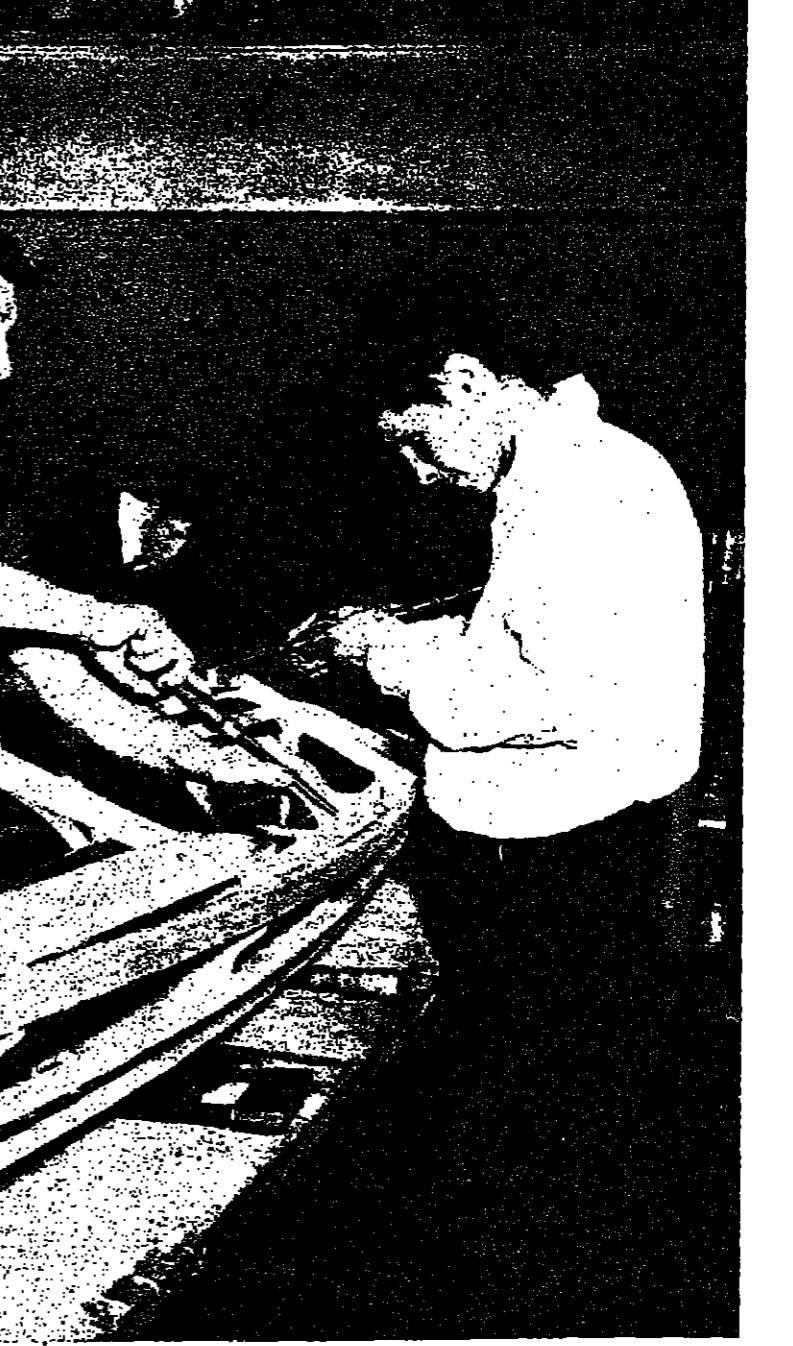
ثلاثة من أعضاء أحد نوادي الشباب في بريطانيا، يصفون قارباً لهم ليخروا به عساب اليم ..

ويوجه صحيح، أصبح من المشكلات التي يواجهها الشباب الممارسون في العالم أجمع، ولهذا كانت المبادئ الخاصة بالنشاط الداخلي من الأمور الأساسية، والبحث بناء لا يصعب على الأعضاء الوصول إليه سيرا على الدوام، شرط أن تكون فيه الإصابة والتفتتة مؤفران، وأن يسوده جو الزمالة الصحيحة، ومن أهم الأشياء أن تتاح الفرصة للأعضاء ليساهبوا في إعداد النادي وترتيبه، بل في بنائه أن أمكن، حتى يشعر كل واحد منهم بالانتماء والاعتزاز بعرضه واعتباره ملكا له. ومن لوازم ترسيخ هذا الاعتبار أن يدفع كل واحد مساهمة أسبوعية زهدا من المال. انتخاب اللجنة الإدارية للنادي وعلى أن افتتاح النادي يدمى الأعضاء لاقتراح أسماء زملاء لهم يعتقدون أنهم يصلحون لقيام بأعباء الإدارة الداخلية لمدة تراوح بين ستة وأثني عشر شهرا تجري بعدها انتخابات جديدة. ثم يختار الأعضاء العدد اللازم من المرشحين، ويمضي تم انتخاب اللجنة، ويجب أن تولى عليها المسؤولية الكاملة للإدارة الداخلية بما في ذلك السلوك العام المسوح به داخل البناء ووضع الأنظمة التي تراها ضرورية، وبرامج الألعاب والتسليقة خلال المساعمت التي ينتج فيها النادي، وتدريب البنات